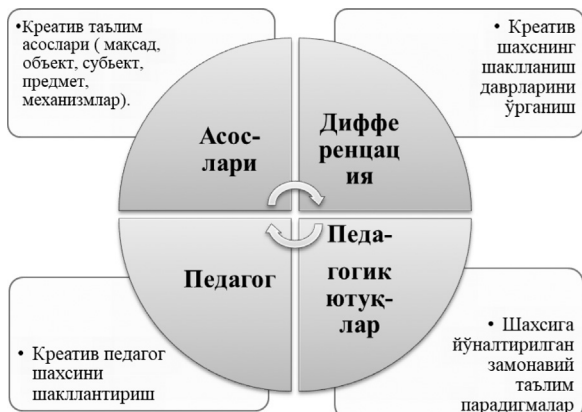
1.1-расм. Креатив педагогика структураси

“Креатив педагогика” фани бутунги кун талабларидан келиб чиққан ҳолда ҳар бир шахсни шу жумладан, бўлажак мутахассисларнинг ижодкор шахс сифатида касбий камол топишлари учун зарур шарт-шароитни яратишга хизмат қилади ва бунинг учун икки жараёнини ўрганиши лозим: