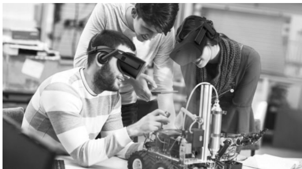
1-rasm: Muhandislik ta'limini raqamlashtirish dolzarbligi

tamoyillari kiradi [3]. Ushbu muammolarni hal qilish uchun universitetlar global qarashlar, sanoat va texnologik ta'lim va umrbod ta'lim imkoniyatlari orqali o'zlarining akademik dasturlarini kuchaytirishlari kerak [4]. Ta'lim muassasalari muhandislikning texnik, iqtisodiy, ijtimoiy, axloqiy va ekologik jihatlarini qamrab oluvchi samarali pedagogikani ishlab chiqish orqali bo'lajak muhandislarni zamonaviy sanoatning vazifalarini hal qilish uchun zarur qattiq va yumshoq ko'nikmalar bilan qurollantirishi mumkin [5].