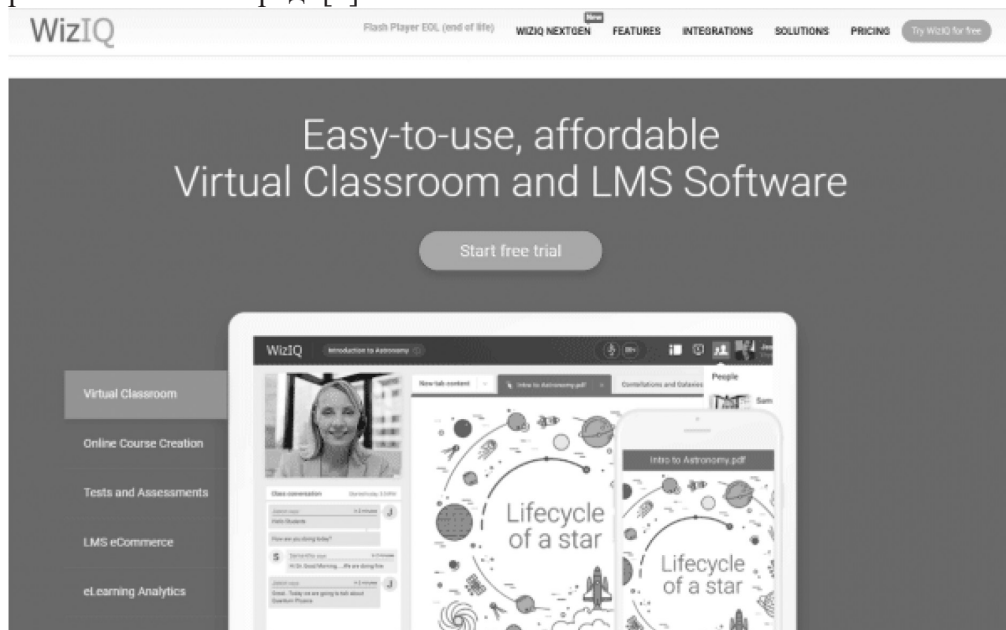
4- расм. WizIQ ойнасида иш бошлаш жараёни. Асосий имкониятлари:

WizIQ сизга яхлит таълимни бошқариш тизимини тақдим этади ва виртуал ўқув муҳити бўлиб, унинг ёрдамида сиз ўзингизнинг ўқувчиларингизни ўқитишни осонгина ташкил қилишингиз ва бошқаришингиз мумкин. У талабаларга реал вақтда аудио, видео ёки матнли мулоқотдан фойдаланиш имкониятини бериб, мультимодал ўрганишни кўллаб-қувватлайди. Виртуал синф ва HD видео конференция имкониятлари билан талабалар вебинарларга қўшилишлари, синхрон онлайн дарсларда қатнашишлари ва гуруҳ топшириқларида тенгдошлари билан ҳамкорлик қилишлари мумкин. Иштирок этишни янада ошириш учун сиз талабаларга интерфаол доскалар, викториналар ва ҳаттоки викториналардан фойдаланиш имкониятини беришингиз мумкин. WizIQ ҳам иш столи, ҳам мобил қурилмаларда мавжуд бўлиб, фойдаланувчиларга қулай курс яратувчиси ёрдамида ўқув материалларини лойиҳалаштириш, соzлаш ва амалга оширишни осонлаштиради[4].