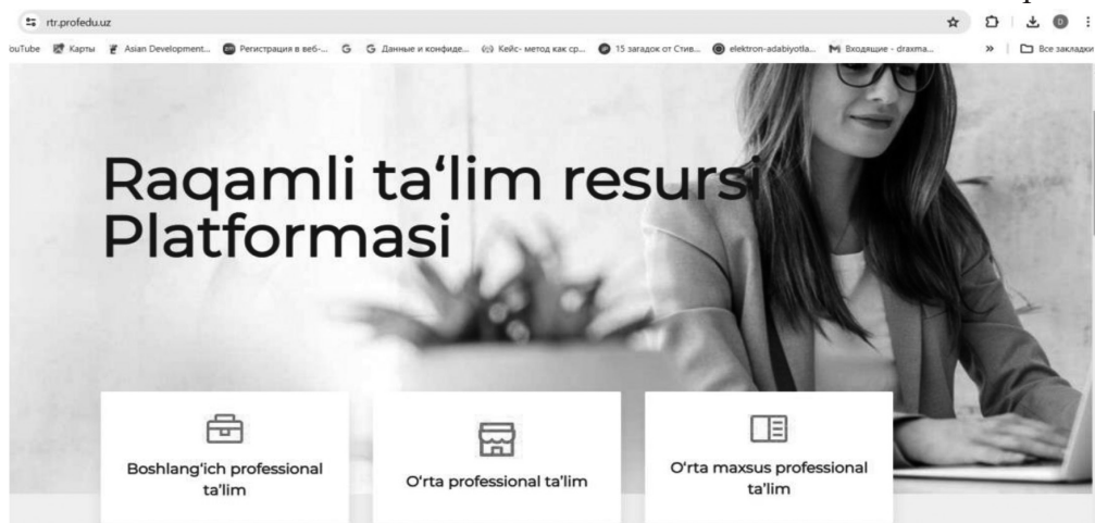
1-расм. rtr.profedu.uz рақамли таълим ресурслар платформаси