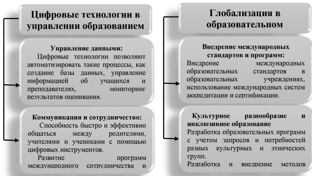
Рисунок 2. Цифровые технологии и глобализация в сфере управления образованием

Цифровые технологии и глобализация создают новые возможности в управлении образованием и способствуют повышению глобальной конкурентоспособности образовательных учреждений. Эти два фактора играют важную роль в адаптации образовательных систем к требованиям современного общества и обеспечивают эффективность, удобство и глобальную интеграцию образования.