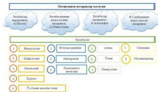
2-расм. “Мотивацион назариялар мазмуни” мавзуси бўйича метарежа намунаси

Метарежанинг ўқув жараёнидаги афзаллиги шундаки, эмоционал-ҳиссий шакллардан фойдалаш орқали ўқув материални ўзлаштириш жараёни тезлашади ва осонлашади. Масалан, мотивлар назариясига доир куйидаги метарежани намуна сифатида келтириб ўтиш мумкин (2-расмга қаранг).