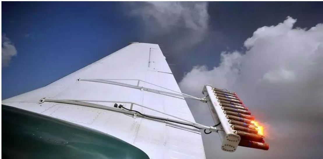
(2-сүўрет) 1940 -жылларда General Electric илимпазлары тәрепинен ислеп шығылған

1940 -жылларда General Electric илимпазлары тәрепинен ислеп шығылған самолётлардан бултларды ёдлы гумис ямаса басқа дузлар менен жаўын жаўдырыу жасалма жаўының ахмийетли усылы есапланады. (2-сүўрет)