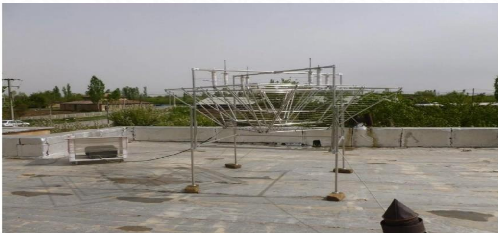
(4-сүүрет) Алтай Айнабектиң Арал теңизин жасалма жаўын жаўдырыў технологиясы.

Жоқарыда көрсетилген жасалма жаўын жаўыўдырыў усылларының улыўма кемшилиги сонда оларды әмелге асырыў ушын төменги қатлам бултлары тийкарғысы болыўы керек. М.О.Ауезов атындағы Қубла Қазақстан Университети илимпазлары жасалма жаўынды пайда етиў технологиясын жараттылар бул технологиядан пайдаланып атмосфераға унамлы зарядланған ионларды жиберий мүмкин хәм ашық аспанда жаўын бултларын топлаў мүмкин. Егер жаңа технология сынақтан табыслы өтсе аймақта 5 қурылма орнатылады. Бир әсбап 200 км радиусда ислейди хәм 160 000 квадрат км ди өз ишине алады. (3-сүүрет)