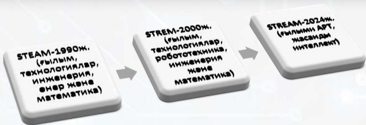
1-сурет. STEM аббревиатураларының өзгеру динамикасы

Дүниежүзі бойынша ең алғышқы STEM туралы түсінік американдық ғалым Р.Колвеллдің зерттеулерінде көрініс тапты [3.23]. Зерттеуші ХХ ғасырдың аяғында 1990 жылдары өз зерттеулерін ұсына бастады, бірақ он жыл өткен соң ғана, яғни 2000 жылдардан бастап белсенді түрде қолданысқа енгізілді (1-суретте).