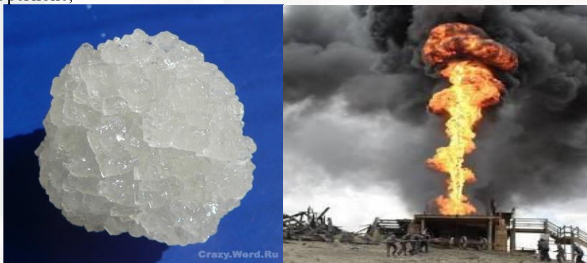
Рис.2. Основные минерально-сырьевые ресурсы Каракалпакстана

- слабо развита горнодобывающая промышленность региона. На её долю приходится лишь 2% всей добывающей промышленности Узбекистана, тогда как значительный запас минерального сырья республики расположен именно в этом регионе;